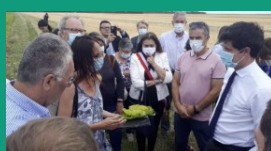
Seine et Marne – 14 juillet