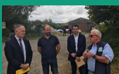
Oise – 3 juillet