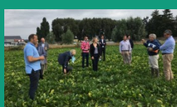
Aisne – 17 juillet