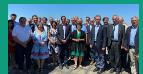
La filière mobilisée - 21 juillet