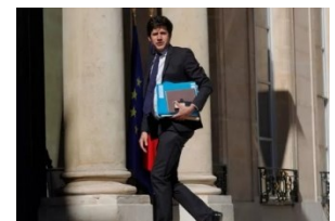
Julien Denormandie, ministre de l'Agriculture et de l'Alimentation

Pour Barbara Pompili, ministre de la Transition écologique, "une autorisation provisoire et encadrée est la seule solution pour lutter contre les pucerons vecteurs du virus de la jaunisse... et préserver la filière".