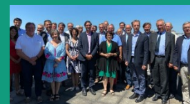
La filière mobilisée - 21 juillet