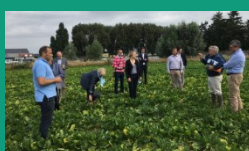
Aisne – 17 juillet