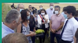
Seine et Marne – 14 juillet