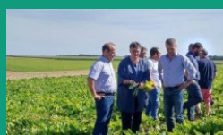
Loiret – 19 juillet