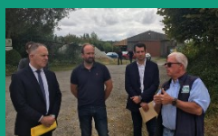
Oise – 3 juillet

Interpellé sur le sujet au Sénat, le Ministre de l'agriculture a déclaré : " Le gouvernement cherche une solution... La détermination est aussi forte que mon inquiétude, elle est totale pour trouver une solution... sans aucune démagogie et avec beaucoup d'énergie ".